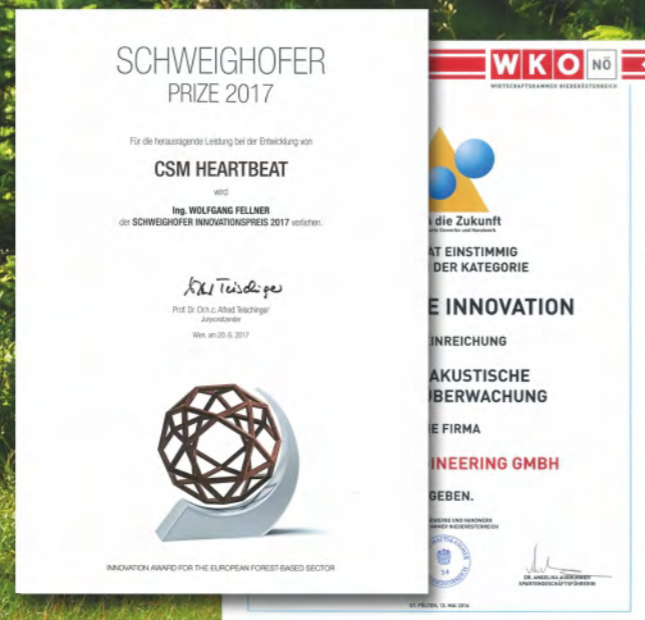
Le système breveté CSM Heartbeat a reçu des prix de l'Innovation de la compagnie Schweighofer et de la Chambre de commerce de la Basse Autriche.