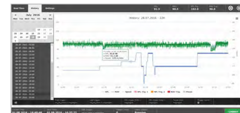
Historique / chronogramme du CSM Heartbeat. Niveau sonore, valeur moyenne ainsi que déroulement et avance sur 1 heure.