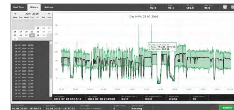
Le MAV (Moving Average / moyenne mobile) illustre l'usure des lames. L'augmentation du MAV est le signe d'une usure croissante. Le moment de maintenance est ainsi déterminé avec précision.

Chaque plus petit bruit anormal est enregistré et les impulsions correspondantes sont transmises immédiatement au système de commande de la ligne de sciage. Avant même que les moteurs ne commencent à absorber plus de courant en raison de la charge plus élevée, la surveillance acoustique des scies circulaires lutte déjà contre elle. CSM Heartbeat